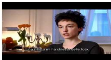
Erasmus for Young Entrepreneurs success stories - IT