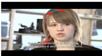
Experience gained from participating in the Erasmus for Young Entrepreneurs Programme-IT