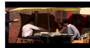
Obtaining management techniques for social entrepreneurship - IT