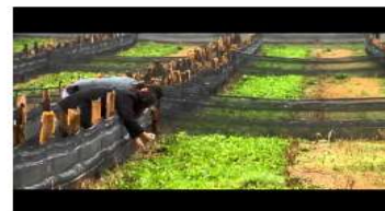
Breeding of edible snails brought together an Italian agriculturist and two Greek entrepreneurs - IT